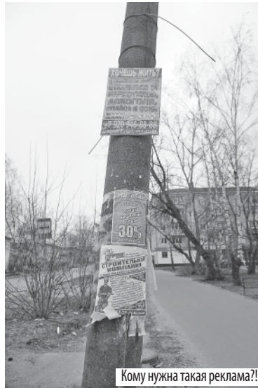
Кому нужна такая реклама?!