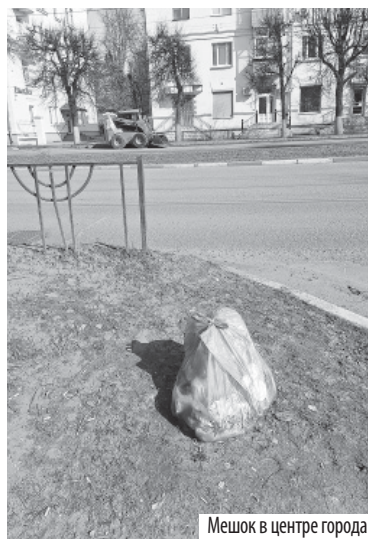
Мешок в центре города

препятствие с дороги, но кто же без резиновых сапог в этот омут полезет?