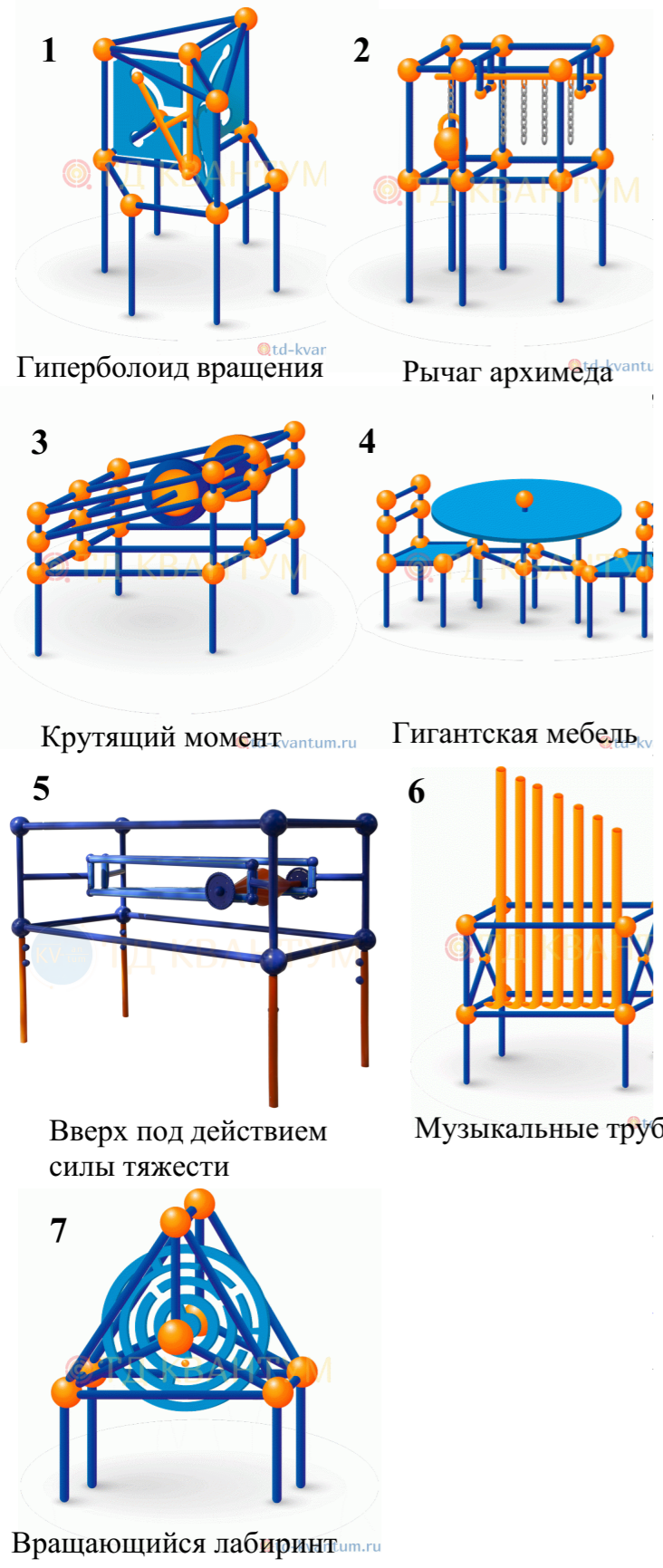
1 Гиперболоид вращения